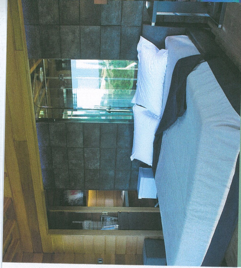
Gli eleganti arredi della Black Cabin.